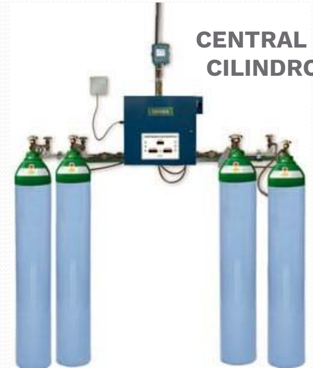
CENTRAL DE CILINDROS