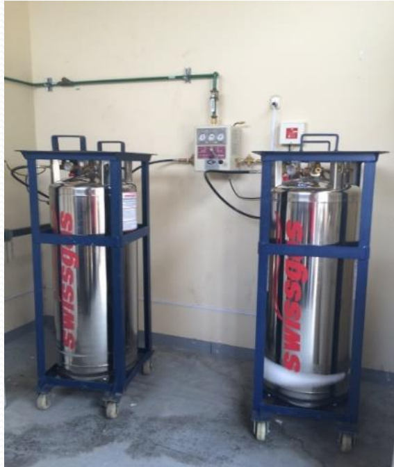
TERMOS O DEWAR